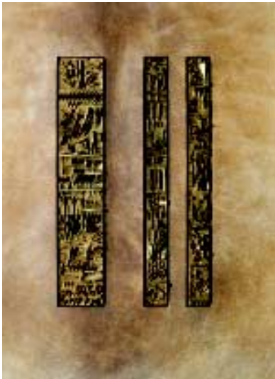
Arnaldo Pomodoro, [Cat. 1b]

Sono gli elementi di primo contatto fra lettore e libro. Con il loro aspetto possono anticipare non poco del contenuto formale che ci si può attendere, una volta aperte. L'intervento dell'artista comincia spesso da qui e può essere limitato alla mera decorazione della carta o assumere, via via, contenuti più complessi, come avviene quando uno scultore, approfittando della tridimensionalità dell'oggetto libro, giunge a trasferirvi le forme plastiche a lui più congeniali.