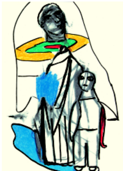
Sandro Chia [Cat. 30]