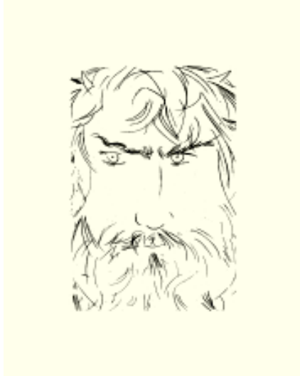
Giacomo Manzù, [Cat. 2b]