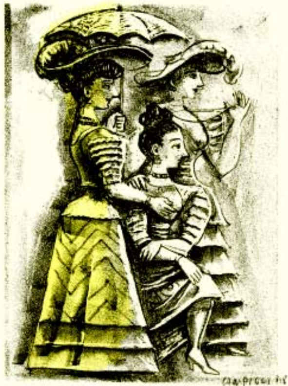
Massimo Campigli, litografia per Theseus di André Gide. Verona, Officina Bodoni, 1949. [Cat. 8]