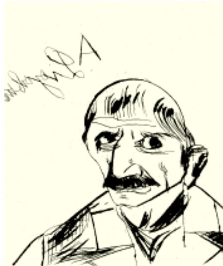
Antonio Ligabue, [Cat. 7]

Tutte le diverse tecniche di riproduzione di immagini consentono la policromia purché per ogni colore sia predisposta una specifica matrice.