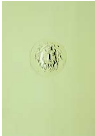
Giacomo Manzù, [Cat. 2a]