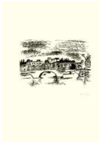
Orfeo Tamburi [Cat. 14]

Acquafornte per Eau sur terre | Cinq poèmes d'Alain Jouffroy sur cinq gravures de Manina . Verona, Renzo Sommaruga, 1974-1975, 65 esemplari.