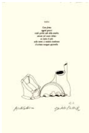
Bartolo Cattafi, [Cat. 13]