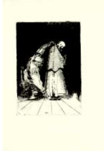
Pietro Annigoni, [Cat. 19]