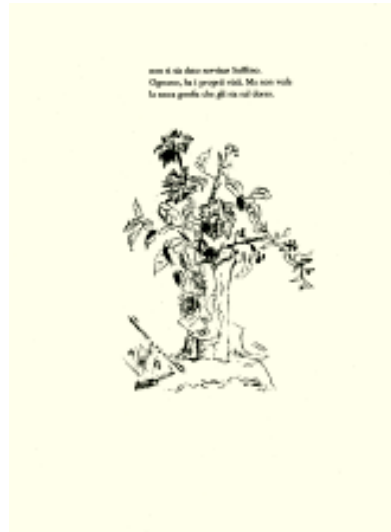
Filippo De Pisis, [Cat. 21]