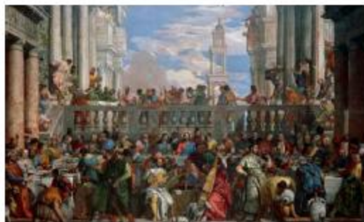
Nozze di Cana, dipinto di Paolo Caliari detto il Veronese del 1563