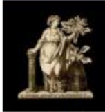
ACCADEMIA DI AGRICOLTURA SCIENZE E LETTERE DI VERONA