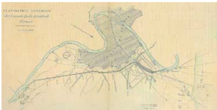
Planimetria del Progetto di Enrico Carli.