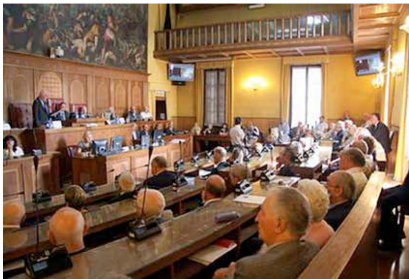
Incontro del 24.9.2011 in Sala consiliare R.Gozzi