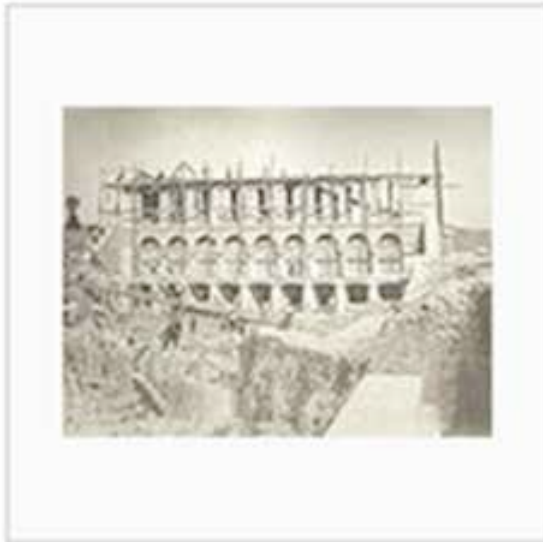
Stato dei lavori all'incile il 5 agosto 1884.