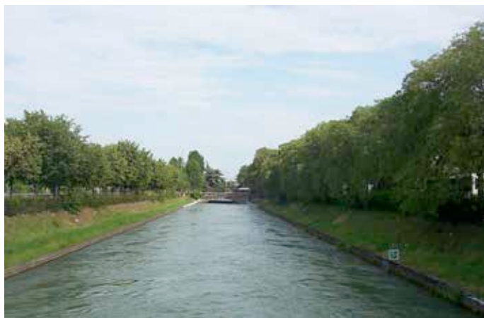
Tratto del canale Camuzzoni vicino alla stazione di Porta Nuova.