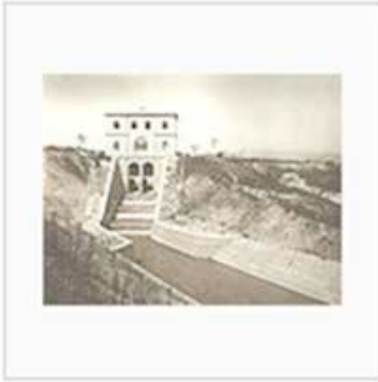
Prospetto a valle del regolatore automatico del pelo d'ammissione e scaricatore.