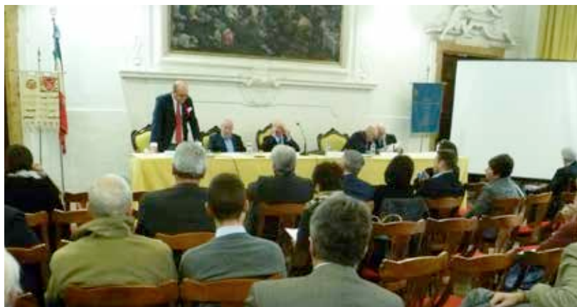
Incontro del 10.10.2016 presso l'Accademia di Agricoltura Scienze e Lettere di Verona