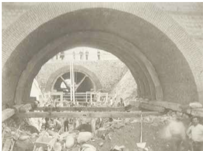
Particolare della costruzione del sottopassaggio della ferrovia in corso Porta Nuova.