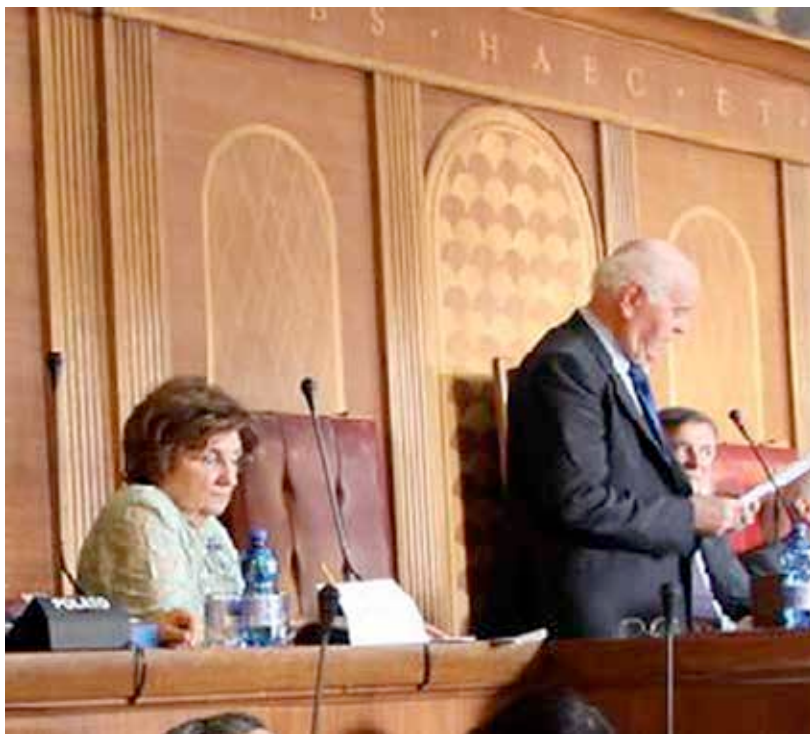
Incontro del 24.9.2011