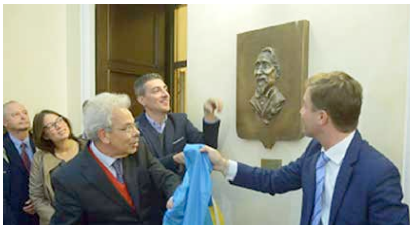
Scoprimento del busto nell'atrio di Palazzo Barbieri