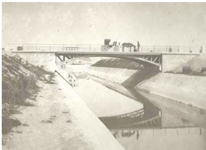
Ponte per la Strada Lombarda. Obliquo a 42^{\circ} 18' ad archi metallici di 16,60 m di corda