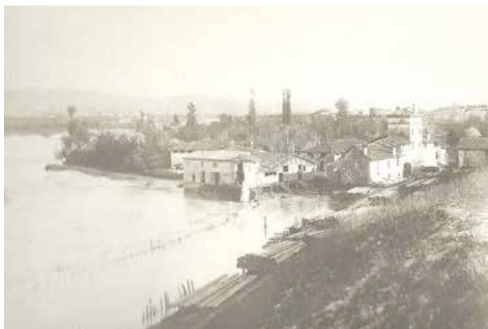
Località dell'incile poco prima dell'inizio dei lavori.