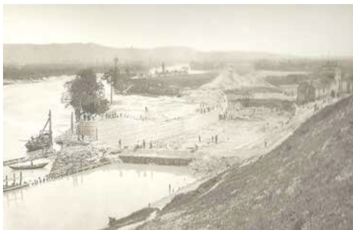
Stato dei lavori all'incile il 5 maggio 1884.