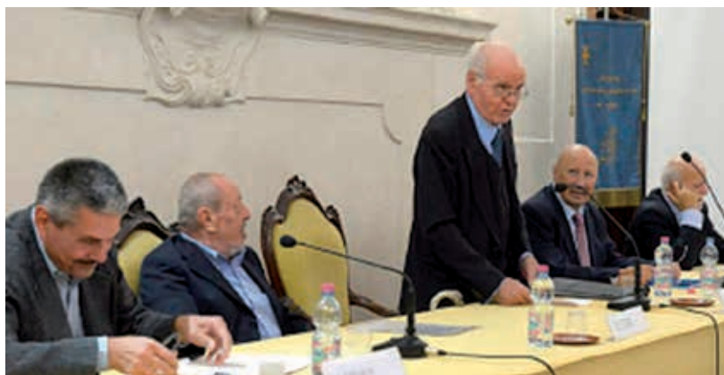
Incontro del 10.10.2016 presso l'Accademia di Agricoltura Scienze e Lettere di Verona

Se non c'è nessun'altra richiesta, la cerimonia continua in Municipio, quindi poniamo termine a questa parte della celebrazione. Ringrazio il pubblico intervenuto con tanta attenzione e tanta pazienza, perché queste cose richiedono anche pazienza. Grazie a tutti e buonasera.