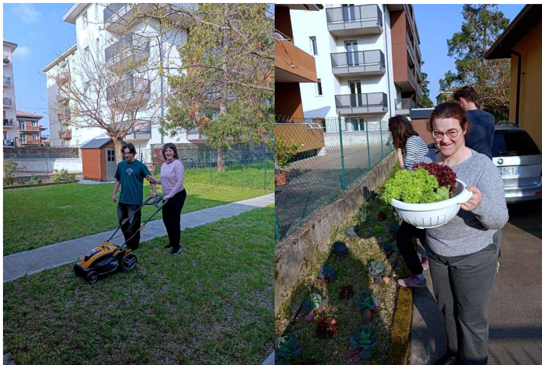
1. RAGAZZI IN ATTIVITA' ALLE CASETTE