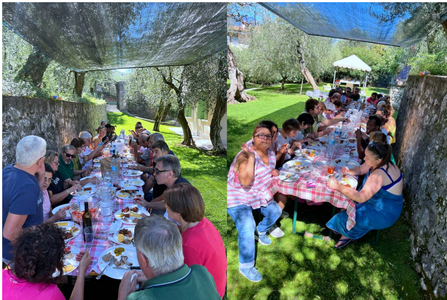
3. RAGAZZI E GENITORI INSIEME