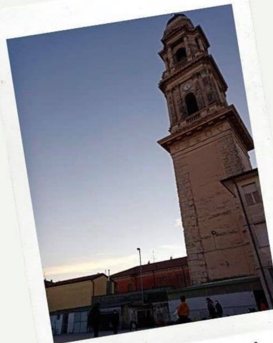
il campanile di Cadidavid

uscita lungo le vie del nostro quartiere per scoprire insieme la sua storia