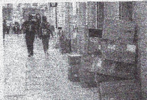
Sono le 10 cartoni ammucchiati davanti ai negozi in via Mazzini