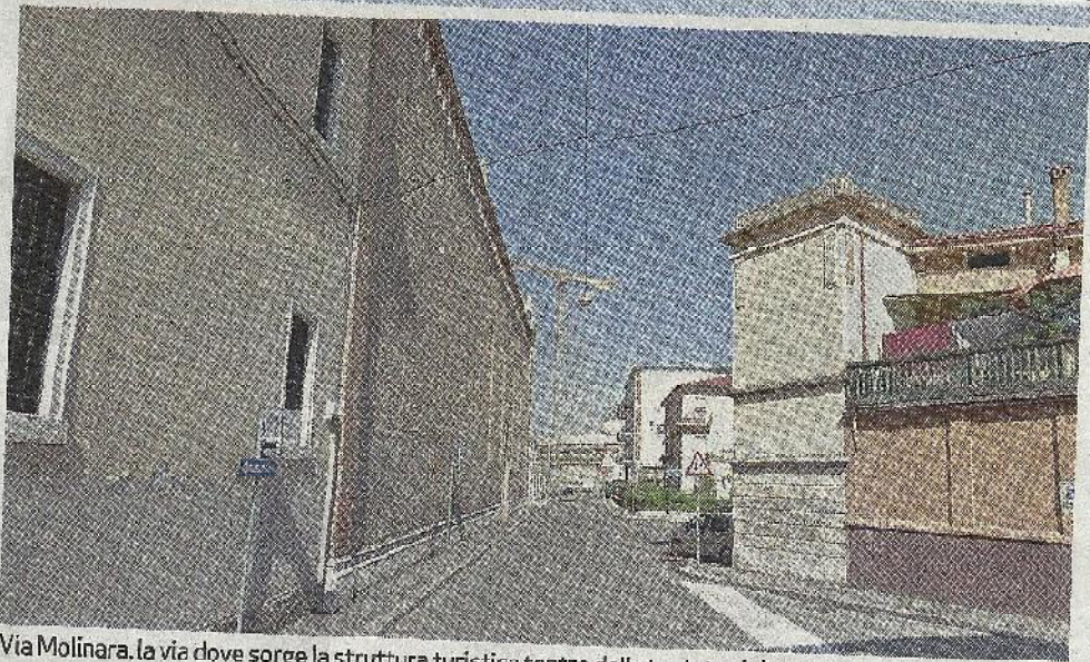
Via Molinara, la via dove sorge la struttura turistica teatro della tentata violenza

La signora ha preferito non parlare con il commissario di quartiere per non compromettere l'indagine. «Sono arrivati mercoledì mattina e dovevano rimanere poi sono rimasti. Di sicuro quello che è successo è spiacevole, per loro, ma abbiamo avuto dei testimoni che ci ha detto cosa sia successo». Le turiste raccontano che dopo si sono trovate a casa i tre sconosciuti a forzare la porta. Il resto - discussione, tentata violenza sessuale (denuncia ora) ignoti. •